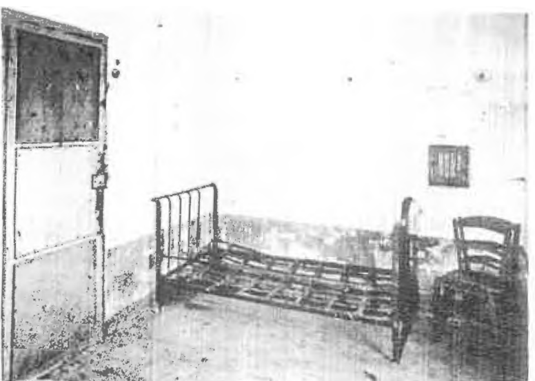
החא של ואן גוך בבית חולים בסן-רמי

הערת המערכת: הלקטון הפרטים הביוגרפיים הנוגעים לואן גוך ולבני משפחתו המובאים כאן, אינם תואמים את הביוגרפיה שלו, כפי שהיא ידועה ממחקרים.